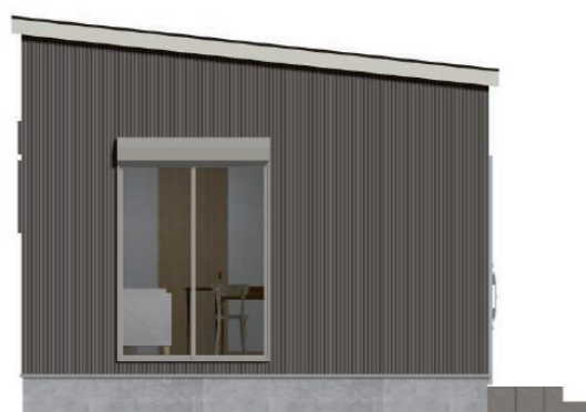
ES 玄関タイプ 1LDK 8.95 坪