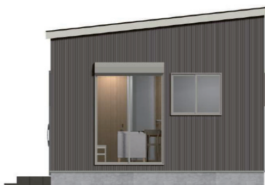
WN 玄関タイプ 1LDK 8.95 坪