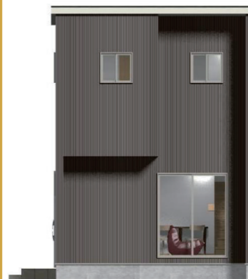
W 玄関タイプ 2LDK 11.89 坪