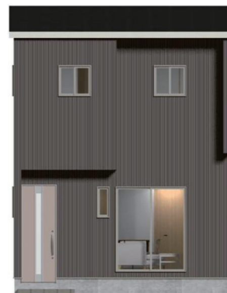
SW 玄関タイプ 2LDK 14.70 坪